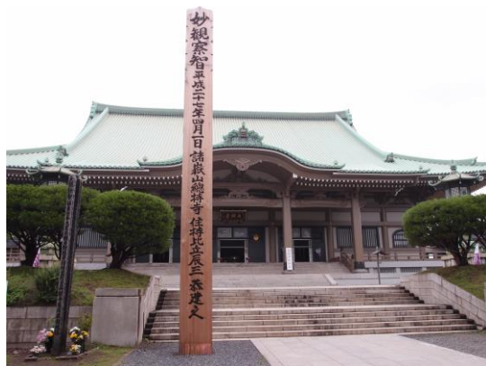
大祖堂（本堂）と、大遠忌の角塔婆